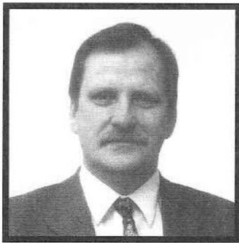
BODO IHRKE, LANDRAT DES LANDKREISES BARNIM

In diesem Jahr, 1998, feiert die Gemeinde Friedrichswalde ihr 250-jähriges Gründungsjubiläum. Gäste aus nah und fern werden sich einfinden, um mit den Friedrichswaldern gemeinsam diese festlichen Tage zu begehen. Sie werden einen Ort vorfinden, gelegen am Rand der historischen Kulturlandschaft der Schorfheide und mitten im Biosphärenreservat Schorfheide-Chorin, dessen Aufblühen vom Stolz der Einwohner ebenso zeugt, wie von ihrem Fleiß und ihrem nachbarschaftlichen Miteinander.